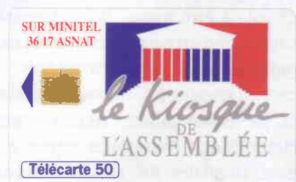
Télécarte 50 Unités tirage 500.000 ex. en oct. 1993

En 1984, la DGT invente le concept du kiosque télématique. Des entreprises mettent en place un service accessible depuis un minitel par un numéro court à 4 chiffres type 3614,