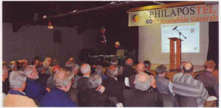
Une assistance attentive !

La 60 ème assemblée générale de PHILAPOSTEL a été précédée par une assemblée générale extraordinaire. Pour permettre l'intégration dans la « Fédération » PHILAPOSTEL de VISUALIA et des NUMISMATES, deux associations de La Poste et France Télécom, à la demande des autorités de tutelle, il fallait modifier les statuts de PHILAPOSTEL dans le but d'élargir le cadre d'activités de l'association au-delà de la philatélie. Un vote à bulletins secrets a permis l'adoption de cette modification statutaire par 70 % de votes favorables.