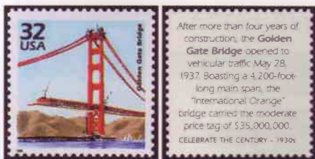
T-P du feuillet émis par l'USPS « Celebrate the century – 1930s » avec commentaire imprimé au verso : le pont en construction.

détruisent 80% des habitations et la plupart des équipements publics. Crise de 1929 aidant, le projet ne revient à la surface que quelques années plus tard, temps nécessaire pour permettre à la séismologie de progresser.