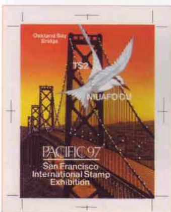
Épreuve de contrôle avant le bon à tirer (Cromalin, format 110x140 mm) de l'émission par Tonga du bloc « Oakland Bay Bridge ». Cet autre pont suspendu sur la baie, également édifié dans les années 30, est remarquable pour ses deux niveaux de circulation.

L'inauguration intervient cependant le 27 mai 1937. Ouverte par la traversée de 200 000 piétons, elle dure 8 jours, pendant lesquels l'illumination nocturne met parfaitement en évidence la couleur très caractéristique de l'ouvrage, qui contribue à sa beauté. Le Golden Gate Bridge est en effet peint en orange, plus précisément en Orange International . Heureusement, les autres peintures proposées, le gris acier, proche de celui du Bay Bridge voisin, la couleur aluminium ou le jaune rayé de noir proposé par l' US Navy ne furent pas retenues, les décideurs