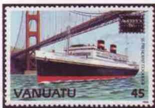
Émission de Vanuatu pour l'Exposition Ameripex 86 : paquebot traversant le détroit sous le pont.

C'est aussi une ville particulièrement typée. D'abord par ses nombreuses collines découpées de rues en pente : à l'intérieur des limites communales, une cinquantaine s'élève au dessus de 30 mètres d'altitude. Certaines d'entre elles abritent des quartiers d'habitation, comme Nob Hill, Pacific Heights, Russian Hill ou Telegraph Hill ; d'autres sont des jardins publics ou des parcs comme Twin Peaks, Mont Sutro, Mont Davidson et Buena Vista. Les cable cars permettent de gravir les plus denses. Ces tramways à traction par câble remontent à 1873 et font figure d'icônes de la cité. Mais SF compte également d'autres symboles qui sont aussi des hauts lieux du cinéma comme ses maisons victoriennes, l'île et ancienne prison d'Alcatraz, Fisherman's Wharf, la Transamerica Pyramid, la Coit Tower. Devenue épicerie de la contre-culture, cette ville de tolérance et d'émancipation des minorités, grande ouverte sur le Pacifique est également connue pour son Chinatown, ses quartiers gay et hippie. Au total, elle représente un foyer économique, culturel et touristique majeur des États-Unis, qui ne laisse indifférent aucun de ses nombreux visiteurs.