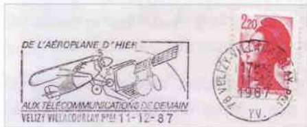
Oblitération machine Sécap

C'est à Velizy qu'ont lieu les premières expérimentations. Elles débouchent sur la nécessité de construire un terminal spécifique pour l'annuaire électronique. Ce sera le minitel ! L'idée d'utiliser la télévision est abandonnée, mais le terme Télétel restera.