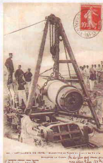
Carte postale « Artillerie de côte ». On distingue les rails sur lesquels repose le berceau de l'affût du canon de 24. Texte : « l'un des gros canons que nous avons. Obus de 159 kg. Poids du canon : 3200 kg ». Des engins de ce poids ne pouvaient être déplacés que sur rail.

Le premier est P.D.C.S.M. S'agit-il des Plongeurs Démineurs du Centre de Secours en Mer, ou pourquoi pas, des Petits Diaboles du Centre Sportif de la Mer ! Il n'en est rien. Il s'agit tout simplement (!) des Postes de Défense Contre les Sous-Marins. Le centre d'instruction correspondant à cette activité était installé dans les locaux de la Marine nationale, au sémaphore de l'Île d'Aix. Son activité fut brève : 1 an de 1914 à 1915. Avant la déclaration de