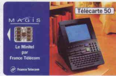
Télécarte 50 unités tirage 2.000.000 ex. en juillet 1995

Le minitel n'aura pas eu droit à une reconnaissance par le timbre-poste. Seule la télématique (fusion des mots Télécommunications et Informatique, mot inventé par les auteurs du livre « l'informatisation de la société ») a eu l'honneur d'un timbre en 1981.