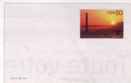
Entier postal émis par l'USPS en 1996 au tarif 50 ¢ : la couleur « Orange international » est somptueusement mise en évidence au coucher du soleil.

pour permettre l'acheminement de la main d'œuvre et des matériaux. Mais ce chevalet sera lui-même percuté et endommagé par un navire égaré dans le brouillard. D'autres incidents graves viennent perturber le bon déroulement du chantier, mais aucun accident sérieux jusqu'en 1936. A cette date et pour la première fois dans l'histoire des ponts, les travaux semblent n'avoir coûté qu'une seule vie. Mais le 17 février 1937, une rupture du filet de protection entraîne 17 morts.