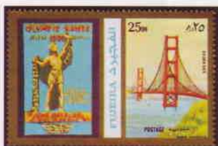
T-P de Fujeira : vue d'ensemble du pont avec ses deux tours, le tablier et les suspentes le reliant aux câbles joignant les tours.

Les travaux débutent le 5 janvier 1933, sous les auspices du Public Works Administration (PWA) puis, à partir de 1935, du Work Projects Administration (WPA) , programmes lancés par le président Franklin D. Roosevelt dans le cadre de sa politique du New Deal , grands travaux destinés à créer des emplois dans les travaux publics sur les fonds fédéraux pour limiter les ravages de la Grande Dépression. Confrontée à de nombreuses difficultés, la construction s'étalera sur plus de quatre ans, pour s'achever en 1937. Les fondations des piles donneront le plus de fil à retordre. Si la pile Nord ne pose pas de problème exceptionnel, l'autre, située en haute