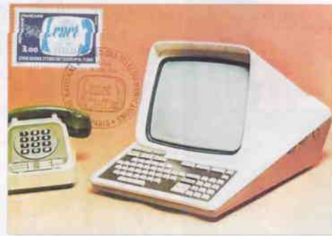
Carte Maximun Minitel 1 de la société Radiotechnique de Suresnes

A cause de la présence à Rennes du CCETT, c'est St Malo et le département d'Ille-et-Vilaine qui sont choisis pour expérimenter ce nouvel appareil, symbole alors de modernité. De 1982 à 1983 tous les abonnés au téléphone d'Ille-et-Vilaine sont dotés du Minitel pour tester l'annuaire électronique.