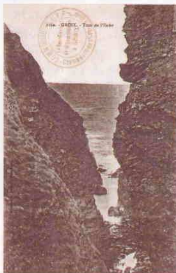
Carte postale « le trou de l'enfer à Groix ». Marque administrative : « COMMISSION A.L.V.F.- Champ de tir de S t Pierre Quib on Le Représentant de la Commission à Groix ».

en faire. Rigolons tout de même ». La deuxième marque a été apposée à l'Île d'Aix sur une carte écrite le 22 mars 1918 par Rossignol, 10 ème RAP, 49 ème batterie. La correspondance est familiale : « j'arrive de la pêche avec un camarade qui veut aller en permission et il veut faire comme moi j'ai fait pour toi ; il a un petit garçon, comme toi, pour lui en faire goûter ».