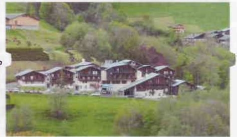
Le village Azuréva d'Arêches.

Le site se prêtait pourtant au repos récupérateur : chalets de montagne, cadre bucolique à souhait où tarines et abondances observaient, depuis le versant opposé, nos débats au travers des larges fenêtres des salles de réunion ou du restaurant. La qualité de l'accueil, la prestation de la direction et du personnel d'AZUREVA nous déchargeant des tâches matérielles et logistiques et la disponibilité de l'équipe de PHILAPOSTEL Rhône-Alpes conduite par Alain DAILLET ont donné le ton de la réussite à ce congrès du 60 ème . Le gâteau d'anniversaire fut d'ailleurs partagé car en 2012, AZUREVA fête ses 60 ans d'existence comme PHILAPOSTEL.