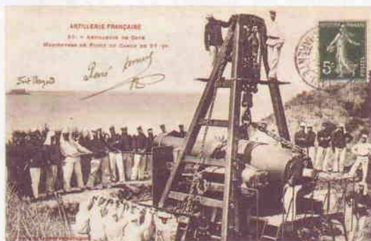
Carte postale « Île d'Aix – Le Fort en mer (Boyard). Marque administrative « CENTRE D'INSTRUCTION des P.D.C.S.M. – ÎLE D'AIX ».

Q uoi de plus frustrant pour un collectionneur de ne pas connaître la signification d'un sigle aux initiales hermétiques. Les expliquer ouvre des possibilités de connaissance. Démonstration à partir de quelques exemples.