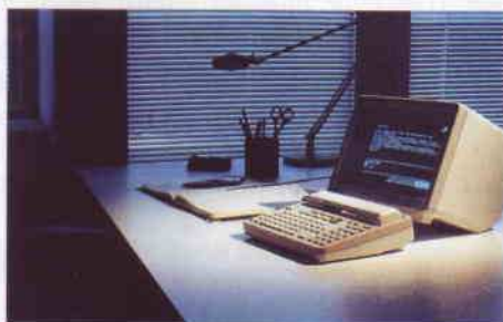
Carte postale éditée et distribuée en 1989 par France Telecom pour informer ses correspondants que l'on dispose d'un Minitel 12 et d'une messagerie écrite.

Le minitel 12, né au printemps 1989, comporte un répondeur télématique permettant de laisser un message écrit : le début du mail !