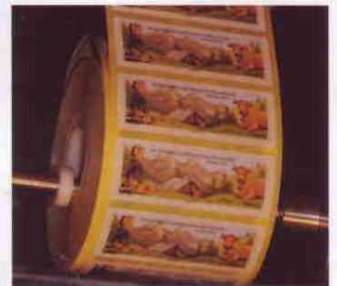
La fameuse LISA que les collectionneurs se sont arrachés.