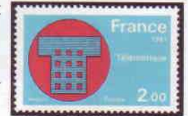
Yvert & Tellier n° 2130

Le minitel n'aura pas eu droit à une reconnaissance par le timbre-poste. Seule la télématique (fusion des mots Télécommunications et Informatique, mot inventé par les auteurs du livre « l'informatisation de la société ») a eu l'honneur d'un timbre en 1981.