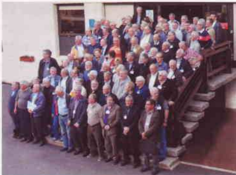
La photo des délégués à l'assemblée générale.

De nombreuses pistes de travail sont ressorties des discussions. En particulier, il a été suggéré au conseil d'administration de lancer un audit des services afin de veiller à leur équilibre financier et de créer un nouveau service, consacré au mail art et complément intéressant pour la compétition en classe ouverte. Le mail art permet un nouveau regard sur l'activité philatélique, tout en suscitant l'intérêt des femmes pour la philatélie. L'intégration de VISUALIA et des NUMISMATES devrait conduire à une réflexion sur le développement de la multi-collection, source de nouveaux adeptes qui trouveraient une réponse au comportement de zappeur des collectionneurs de notre époque.