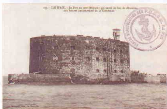
Carte postale « Artillerie française – artillerie de côte ». Un P.D.C.S.M. était installé à l'Île d'Aix.

la Première Guerre mondiale le 4 août 1914, la défense des côtes concernait les grands ports de guerre et de commerce et les sémaphores placés sur tout le littoral, aux endroits névralgiques. Car depuis le 19 ème siècle, tous les stratèges militaires considèrent que le destin des nations est tributaire de la maîtrise de la mer qui l'emporte toujours sur la puissance terrestre. Mais la nature des conflits maritimes a changé. Ce n'est plus l'époque des grandes batailles navales décisives entre escadres mais celle de combats plus sournois. L'Allemagne dispose de 111 navires insubmersibles, les sous-marins. Et si sa flotte de haute mer est aisément bloquée par la Royal Navy, les sous-marins allemands attaquent à la torpille les bâtiments de surface, les sémaphores et les bateaux de pêche.