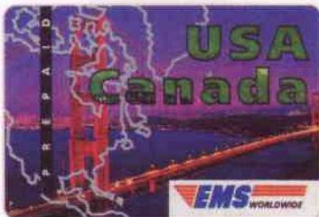
Vignette EMS pré-payée, zone 3, validité Monde, du service postal international pour documents et marchandises créé par l'UPU en 1998 et rassemblant 140 opérateurs.

S an Francisco, couramment abrégé SF , plus familièrement Frisco , est une ville des États-Unis située dans l'État de Californie. Elle occupe l'extrémité nord de la péninsule éponyme, entre l'Océan Pacifique à l'ouest et la baie de San Francisco à l'est, tous deux reliés par le détroit de la Golden Gate , qui signifie « porte d'or ». Fondée en 1776, la cité a pris son essor avec la ruée vers l'or du milieu du XIX ème siècle qui en a fait une place bancaire, marquée par la Wells Fargo , puis est devenue le berceau du blue-jeans avec la fondation de Levi Strauss & Co. À partir de la deuxième partie du XX ème siècle, les hautes technologies se sont développées dans sa région, notamment dans la Silicon Valley . Aujourd'hui San Francisco est l'agglomération la plus densément peuplée des États-Unis après New York. La municipalité compte 805 235 habitants dans ses limites administratives, l'agglomération de San Francisco-Oakland-Fremont, 4 335 391, l'aire métropolitaine, appelée Bay Area , plus de 7 millions, ce qui la place au quatrième rang des métropoles des États-Unis.