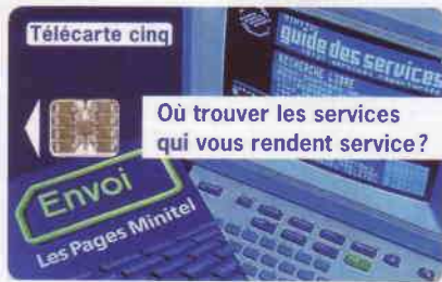
Télécarte 5 unités émise en 1994 tirage 65.000 exemplaires

Un annuaire des services Télétel est mis en place : MGS.