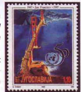
Émission de la Yougoslavie en 1995 pour le cinquantième de la signature à San Francisco de la Charte des Nations-Unies : vue aérienne de l'ouvrage.