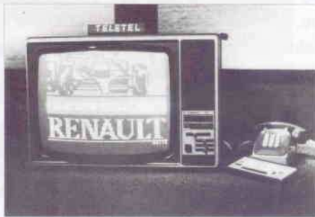
Carte postale des éditions Pierron

En 1977, Alain Minc et Simon Nora publient un rapport sur la "nécessaire informatisation de la société". En 1978, un comité interministériel est consacré à cette question. Il étudie plusieurs projets dont celui consacré à la télématique et à un annuaire électronique. La Direction Générale des Télécommunications met en place ce projet qu'elle désigne sous le vocable Télétel. Le programme Télétel démarre en décembre 1978. Télétel permet de recevoir sur un écran de télévision, des informations par le réseau téléphonique.