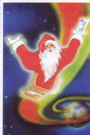
Carte postale créée par Josiane Leroux, éditée en 1986 par La Poste.

Le Minitel et Télétel ont sans doute ralenti d'une année le virage numérique Internet en France, mais ils ont été une formidable école et ont contribué à la création d'une culture « on line » en France.