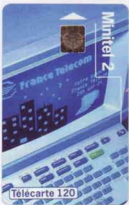
Télécarte 120 unités tirage 2.000.000 ex d'août 1994

Dans les années 90, un service 3615 MINITEL est mis en place par France Telecom. C'est l'embryon d'une recherche type Google pour trouver la météo, les cours de la bourse, des infos santé, etc...