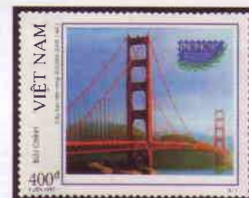
Émission du Vietnam pour Pacific 97 : vue générale soulignant la structure en treillis du tablier.

Strauss voit ainsi son opiniâtreté récompensée. Il a l'intelligence d'engager plusieurs de ses rivaux comme consultants, notamment O.H. Ammann et Leon Moisseiff.