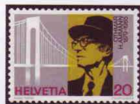
T-P émis par la Poste suisse en hommage à son concitoyen Othmar H. Ammann, collaborateur de Joseph Strauss pour la construction du Golden Gate Bridge et constructeur du Verrazano Bridge (en arrière-plan).

Ainsi, le pont constitue un point de passage de premier ordre, emprunté chaque année par 42 millions de véhicules. D'une largeur de 30 mètres, il offre six voies de circulation. Les plots centraux entre ces voies peuvent être déplacés en fonction du trafic routier. En outre, il comporte deux allées, l'allée Est réservée aux piétons et l'allée Ouest aux cyclistes. Ces deux allées sont fermées du soir à l'aube. Visiteurs de nuit : s'abstenir ! Mieux vaut apprécier son éclairage depuis les rives. ■