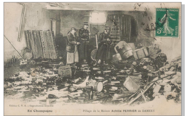
Le constat dans la Maison Achille Perrier.