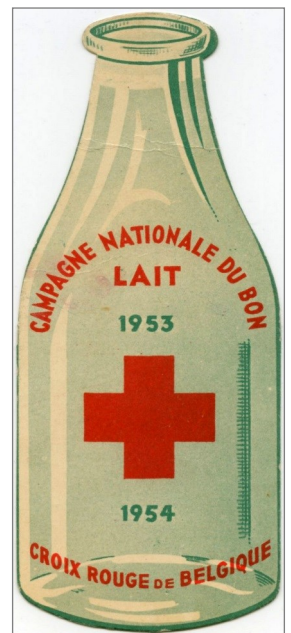
5 Campagne nationale pour le bon lait.