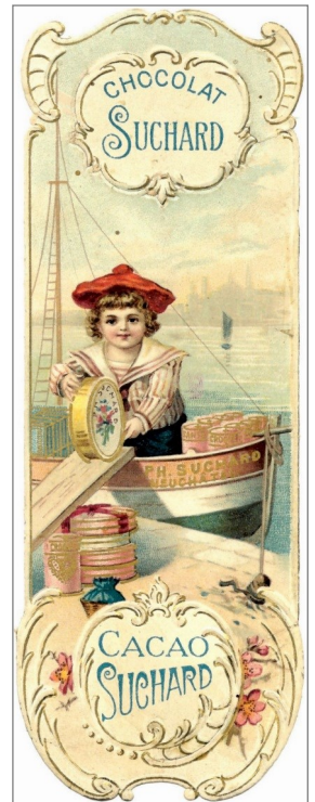
4 Marque-page articulé du Chocolat Suchard.

Le collectionneur puriste se fera un devoir de ne collecter que les marque-pages offerts souvent par des éditeurs ou des distributeurs de livres ou ceux achetés d'occasion.