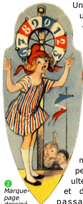
2 Marque-page dessiné par Poulbot.

Un marque-page ou signet est un morceau de papier, en carton rigide, en tissu, ou en cuir, le plus souvent de forme rectangulaire ou découpé, articulé, imprimé en recto ou recto-verso, en une couleur ou en quadrichromie.