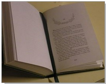
1 Petit ruban en tissu.

L'origine du signet remonte vers 1377, il s'agissait alors de petits rubans qui servaient en particulier à ne pas perdre sa page de missel (1). Quant aux signets publicitaires, ils ont fait leur apparition en Grande-Bretagne, vers 1870, à la révolution industrielle et annonçaient la consommation de masse. Il y a eu deux booms, l'un dans les années 1920 avec les plus rares qui concernaient la publicité pour la loterie nationale (2) et les plus anciens qui avaient la forme de coupe-papier. Ils permettaient non seulement de trancher les pages des bouquins collées les unes aux autres ou non massicotées, mais aussi d'ouvrir son courrier (3). L'autre entre les deux guerres, des marque-pages des compagnies maritimes, aériennes, de chemin de fer et les fabricants alimentaires (4 et 5) qui trouvèrent ainsi la solution pour communiquer en masse et à moindres frais.