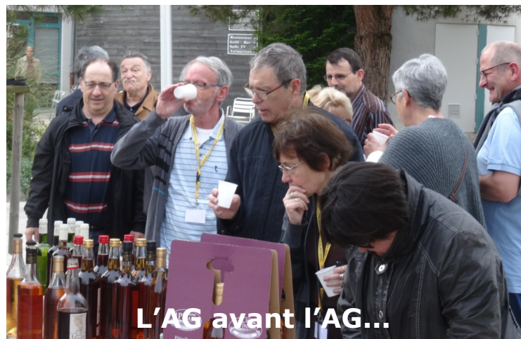
L'AG avant l'AG...